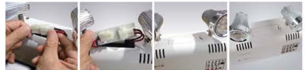
Easy access to connect the wire without open up the case