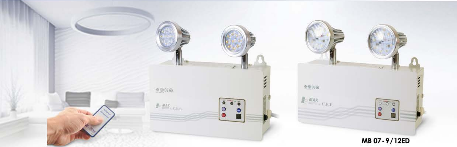
MB 03/04 - 9/12ED