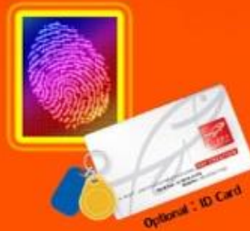
Optional : ID Card

1,500 ลายนิ้วมือ บันทึกได้ 80,000 รายการ จอสี Touch Screen 2.8" ระบบ Access Control ใช้กับกล่องไฟฟ้าได้ทุกชนิด