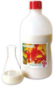
กลี้นนม (Condence Milk)