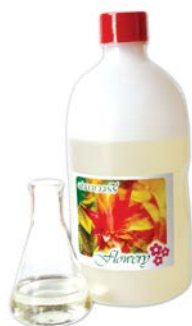
กลิ่นครีมโซดา อีแอล 04572 (Cream Soda Flavour EL04572)