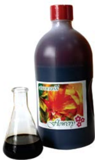
กลี้นกาแฟเอ็กซ์ ไฮเปอร์ (Coffee Flavour Ex Hyper)