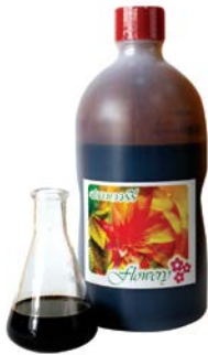
กลี้นช็อคโกแลต ค็อง 50 (Chocolate Flavour Conc 50)