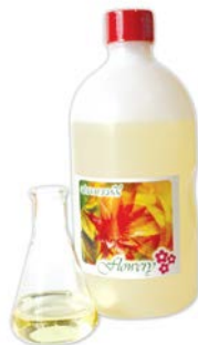
กลิ่นข้าวโพด พี.เอ.ดับบลิว. 300 (Corn Flavour P.A.W. 300)