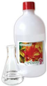
กลิ่นกล้วยหอม 50 (Banana Flavour 50)