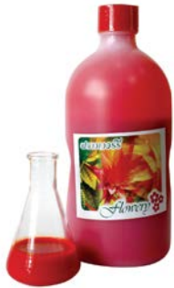
กลี้นส้มวาโย.จ. (Orange Flavour Y.G.)