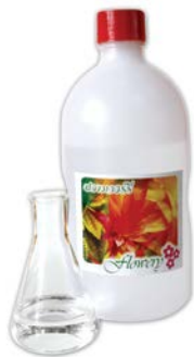
กลิ่นสละไซเดอร์ 50 (Salacider Flavour 50)