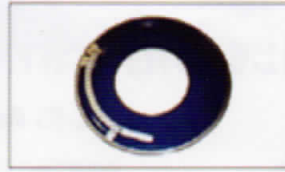
ฝาปิดสำหรับถัง 200 ลิตร