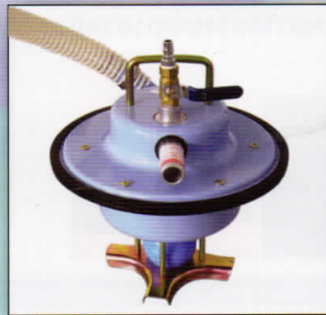
ตัวเรือนหลัก