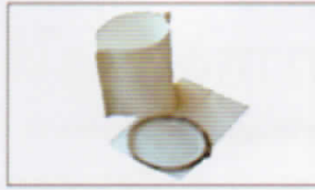
ชุดกรองฝุ่นผง