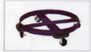
ล้อเลื่อนสำหรับถัง 200 ลิตร