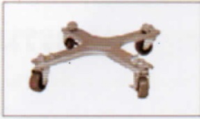
ล้อเลื่อนสำหรับถัง 5 แกลลอน