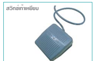
สวิทซ์เท้าเหยียบ