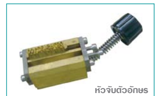
หัวจับตัวอักษร