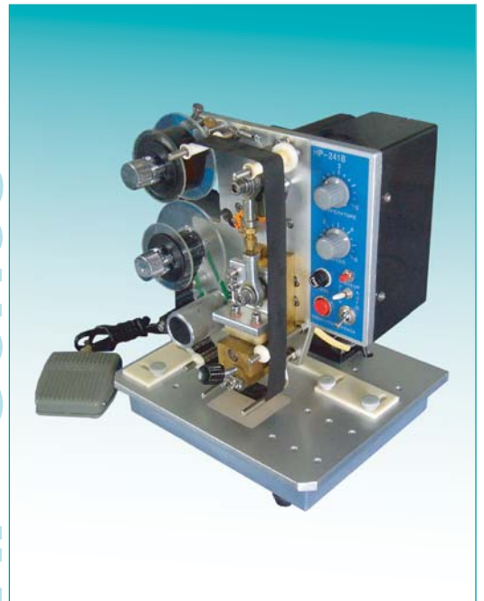
ตัวอย่างชิ้นงานพิมพ์