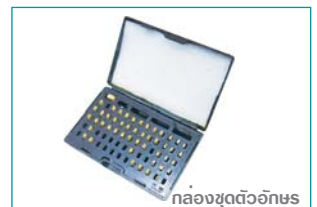
กล่องชุดตัวอักษร