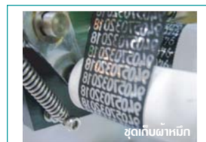
ชุดเก็บผ้าห่ม