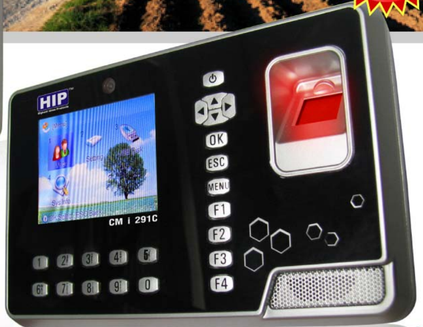
CM i 291C