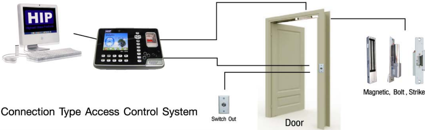
Connection Type Access Control System