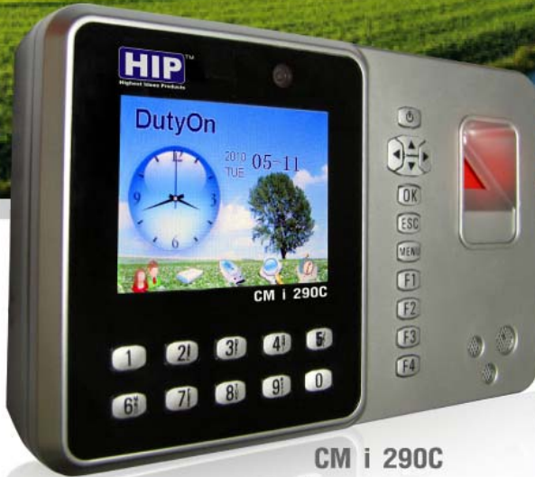
CM i 290C