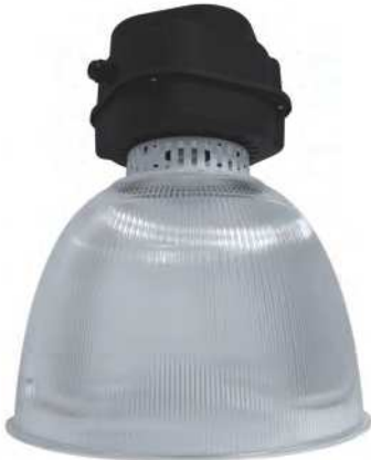
PMMA Reflector Code : 331060