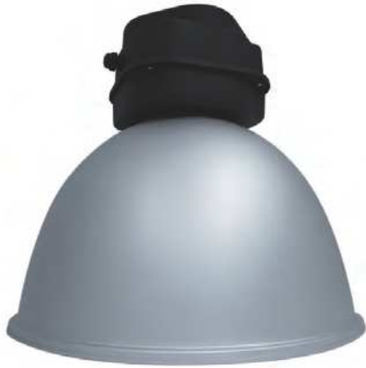
Sand Aluminium Reflector Code : 331058